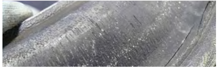
Kırılmış miller ve hasar görmüş diyaframlar ile hazırlıksız yakalanmayın!